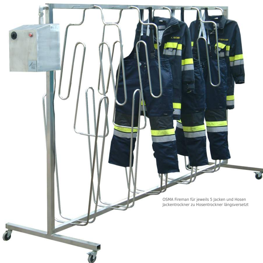
OSMA Fireman für jeweils 5 Jacken und Hosen Jackentrockner zu Hosentrockner längsversetzt

Der „OSMA Fireman“ wird für 3 bis 6 Kleidereinheiten angeboten (Fireman für bis zu 6 Jacken + Hosen oder bis zu 6 Jacken ohne Hosen oder bis zu 6 Overalls). Die Ausführung in Edelstahl ist absolut langlebig und aufgrund der leichten Reinigung sehr hygienisch.